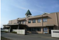
みどりの里(特養・短期・デイサービス・ヘルパー・居宅介護支援・ケアハウス) 古河市東山田4796-2 代表TEL 0280(78)1000