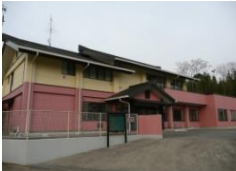
きぬの郷 (デイサービス・居宅介護支援) 結城市粕礼934-3 代表TEL 0296(20)9800