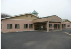
みどりの丘 (デイサービス・ヘルパー・居宅介護支援・訪問入浴) 古河市尾崎3377 代表TEL 0280(75)0550