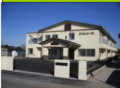
ふるとねの郷 (地域密着型介護老人福祉施設) 官代町和戸860-1 代表TEL 0480(37)3388