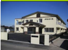
ふるとねの郷 (地域密着型介護老人福祉施設) 官代町和戸860-1 代表TEL 0480(37)3388