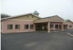
みどりの丘 (デイサービス・ヘルパー・居宅介護支援・訪問入浴) 古河市尾崎3377 代表TEL 0280(75)0550