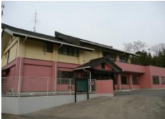
きぬの郷 (デイサービス・居宅介護支援) 結城市粕礼934-3 代表TEL 0296(20)9800