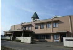
みどりの里(特養・短期・デイサービス・ヘルパー・居宅介護支援・ケアハウス) 古河市東山田4796-2 代表TEL 0280(78)1000