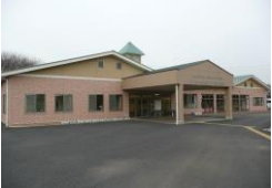
みどりの丘(デイサービス・ヘルパー・居宅介護支援・訪問入浴)