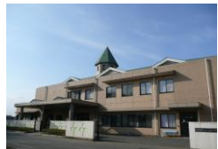
みどりの里(特養・短期・デイサービス・ヘルパー・居宅介護支援・ケアハウス)