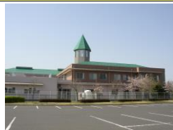
みどりの森(特養・短期・デイサービス・居宅介護支援)