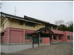
きぬの郷(デイサービス・居宅介護支援)