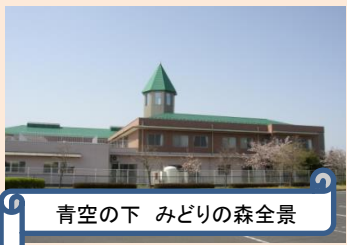
青空の下 みどりの森全景